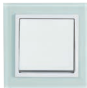
Serie: AURA Glas Design: Matt-Reinweiß