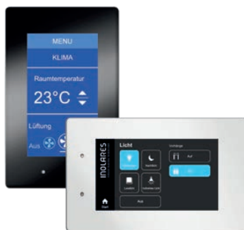
© Design/Bedien-Interface by Inolares GmbH & Co. KG

SBC ist eine 100%ige Tochter der Honeywell-Gruppe. Sie entwickelt, fertigt und vertreibt seit 1978 Steuerungs- und Regelungstechnik, die vor allem in den Bereichen Heizung, Lüftung und Klima verwendet wird. Mit über 200 Mitarbeiter ist das Schweizer Unternehmen ein starker Partner für innovative Lösungen in der Gebäude- und Infrastrukturautomation. Unsere Kunden erhalten Automatisierungslösungen, die durch die freie Programmierbarkeit flexibel sind und sich jederzeit ohne großen Aufwand erweitern und modifizieren lassen – bei einem Lebenszyklus von über 20 Jahren.