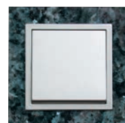
Serie: AURA Stein Design: Labrador Bluepearl