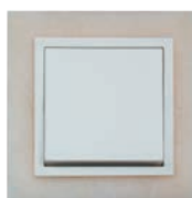
Serie: AURA Stein Design: Estremoz