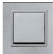
Serie: NOVA elements Metal Design: Edelstahl gebürstet Alu