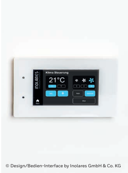
© Design/Bedien-Interface by Inolares GmbH & Co. KG