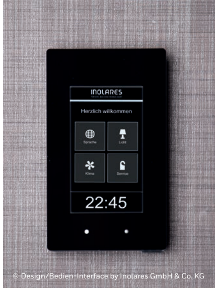
© Design/Bedien-Interface by Inolares GmbH & Co. KG