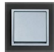
Serie: AURA Glas Design: Schwarz-Anthrazit