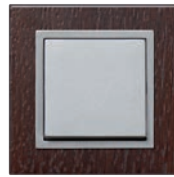
Serie: NOVA elements Holz Design: Wenge Alu