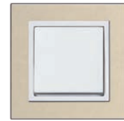
Serie: NOVA elements Lederoptik Design: Creme Lederoptik Reinweiß